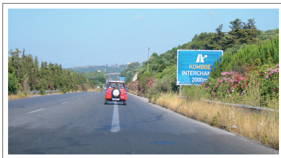
Při některých porovnáních cen docházelo i ke srovnávání dvojpruhových komunikací v zahraničí s našimi standardně čtyřpruhovými dálnicemi!

Pokud se přihlídně k uvedeným faktorům, docházíme k závěru, že jsou ceny českých dálnic na průměrné úrovni.